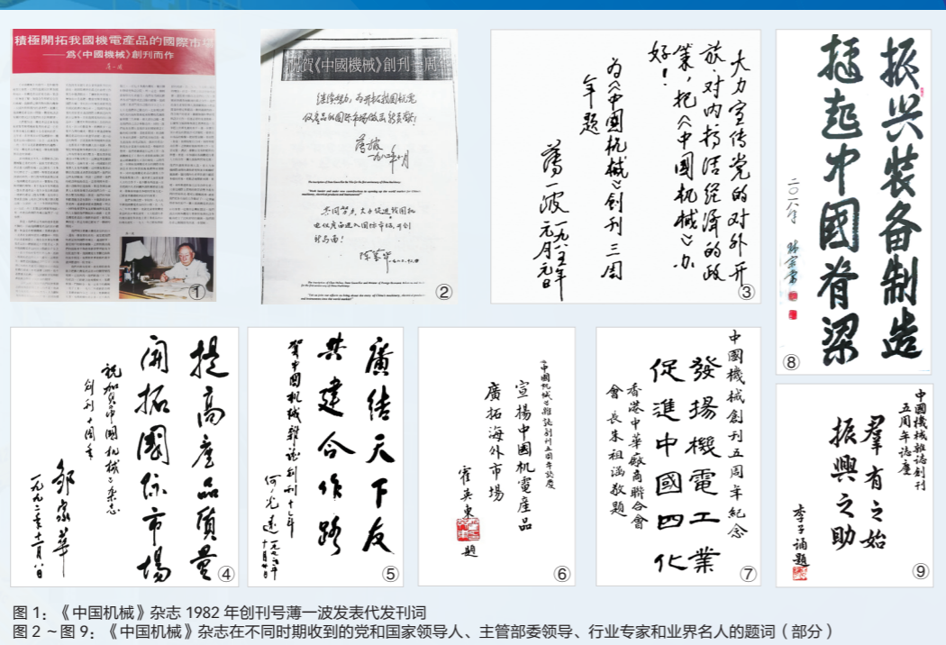
图1：《中国机械》杂志1982年创刊号薄一波发表代刊词 图2~图9：《中国机械》杂志在不同时期收到的党和国家领导人、主管部委领导、行业专家和业界名人的题词（部分）

《中国机械》(Machine China) 杂志, 1982年创刊于北京, 由中国工业经济联合会主管, 中国工业报社主办, 是经国家新闻出版广电总局批准登记的机械工程类学术期刊(旬刊), 系中国知网、万方数据全文收录期刊。